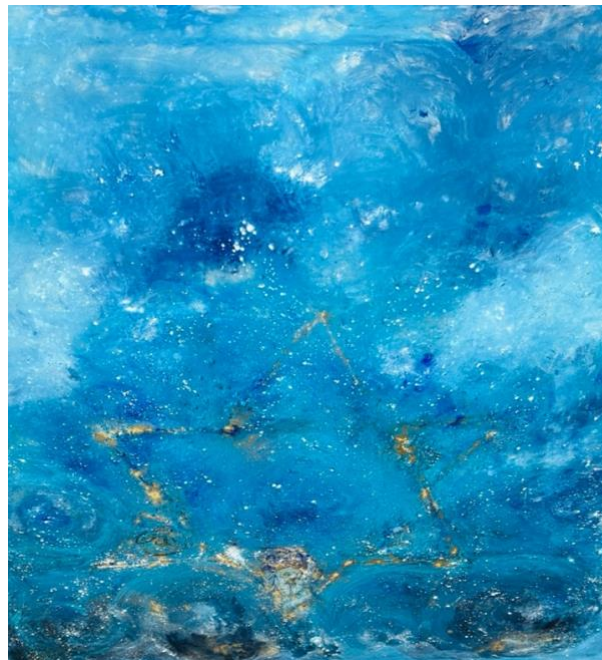
Naturpigmente, Blattgold auf Leinwand, 90 x 130 cm