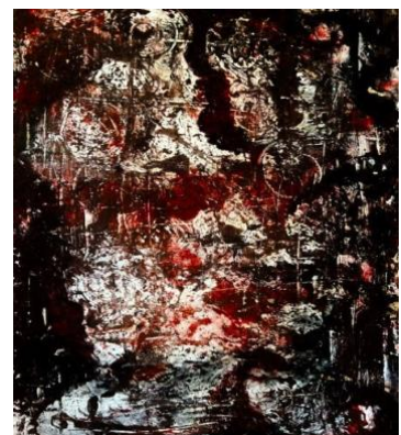
Naturpigmente auf Leinwand, 90 x 130 cm