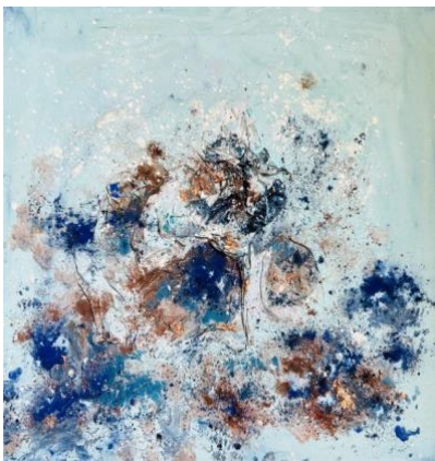
Naturpigmente, Blattgold auf Leinwand, 50 x 50 cm

Kunst Gabe, des Menschen Ideen auszudrücken, die in tiefere Ebenen hinabreichen. Die Fähigkeit, hinter allen Details und der Fülle der Fakten wie in einem Tableau das Wesentliche zusammenzuführen. Visionen sichtbar zu machen, die mit Ratio und Logik allein oft nicht zu erreichen sind.