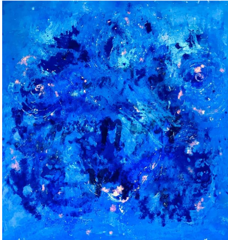
Naturpigmente, Blattgold auf Leinwand, 100 x 100 cm

Die „Ruach“ steht für die weibliche Seite Gottes, die Kreativität, schöpferische Kraft, göttliche Präsenz unter uns Menschen, die Liebe und Lebenskraft. Sie repräsentiert im Judentum auch für die lebendige göttliche Energie, die Inspiration und Entwicklung ermöglicht. Für den göttlichen Funken in jedem und jeder von uns. Das Bild lädt uns ein, dies zu reflektieren, die Möglichkeiten für unser Leben und Handeln zu entdecken, die unser göttlicher Funke uns eröffnet.