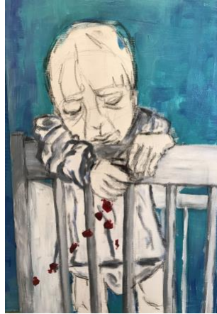
Acryl auf Leinwand, 50x70 cm

Der Rundgang durch die Ausstellung beginnt mit dem Erinnern an das Leid des Antisemitismus. Immer ist es ein Ausgrenzen, ein Verstoßen, ein völliges Verlassensein, die Bedrohung, an deren Ende die Vernichtung steht. Hier von der Künstlerin gesehen und übersetzt in die absolute, existentielle Verlassenheit eines Menschenkindes, stellvertretend für die Verlassenheit und Verstoßung eines Menschevolkes, des jüdischen.