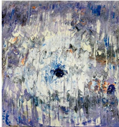
Naturpigmente, Blattgold auf Leinwand, 80 x 80 cm

„Wir werden alle gesehen“ – Dieses Wort aus Uwe Johnsons Roman „Jahrestage“ und dem Film „Cloud Atlas“ zeigt uns den Moment der Wahrheit, in dem die Entscheidung des Einzelnen geschieht, wie klein und unscheinbar sie auch sein mag, für das Leben gegen den Tod einzutreten, für das Gute und gegen das Böse. Einzustehen für die eigenen Werte, für wahre Menschlichkeit und um jüdisches Leben zu schützen. Der Moment, in dem das Zeitliche ins Ewige hineinragt, es berührt: Die Freiheit der Entscheidung, was wir tun mit der uns geschenkten Lebenszeit. Wir werden alle gesehen. Und wir wissen es.