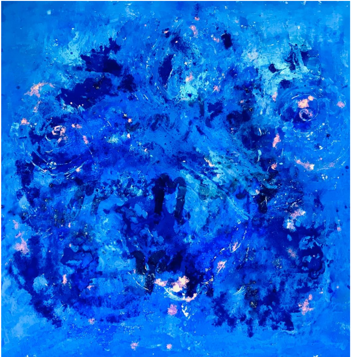
RUACH – göttliche Energie