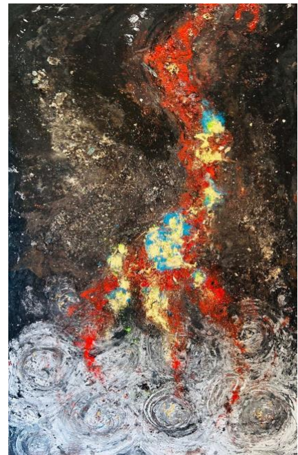
Naturpigmente, Blattgold auf Leinwand 70 x 125 cm

Mit dem Bild „Gerechte unter den Völkern“ wird ein erster, zarter Lichtblick sichtbar, die Erkenntnis, dass anderes möglich ist: Menschen in Deutschland, die nicht die Augen vor der Wirklichkeit verschlossen und Jüdinnen und Juden unter eigener Lebensgefahr vor Deportation, Tod und Vernichtung retteten. Claudia Wühl übersetzt dies im abstrakten Bild mit einem ersten Goldschimmern, einem zarten Türkis als Farbe der Vision inmitten der Spirale des Todes. Ein Auftauchen wie Gold aus dem Dunkel und Tod heraus und die Hoffnung auf die Freiheit menschlicher Entscheidung.